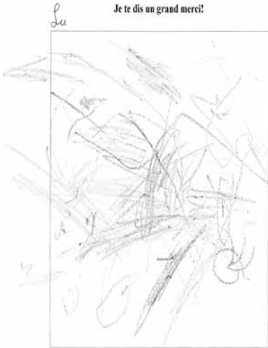
Luna, 2 ans