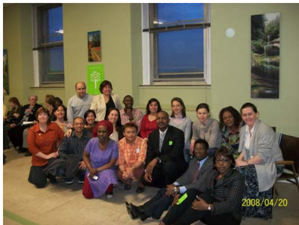
Groupe de la formation régulière soir 2009-2010