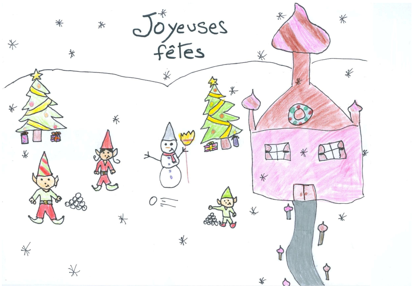
Dessin réalisé par Samuelle Bougeois, 10 ans