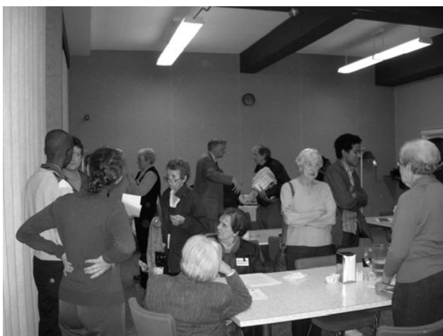
Photo prise lors de notre assemblée générale annuelle du 28 octobre dernier où 29 personnes étaient présentes. Cette réunion fut agréable et bien animée...

En ce qui me concerne, j'ai eu Jésus pour modèle de bénévole ; après avoir lu l'histoire de sa vie, j'ai décidé de poser des actes désintéressés en faveur d'autrui. Et j'ai débuté officiellement mon bénévolat dans mon pays natal auprès des victimes de tempêtes tropicales à travers le système national de gestion des risques et des désastres (SNGRD). Cet acte désintéressé m'a permis, dans la mesure du possible, de m'efforcer de faire du bien à mes semblables. En leur consacrant quelques heures, dans mes précieuses 24 heures, j'ai ressenti une satisfaction interne que je n'avais jamais ressentie auparavant. J'ai vite compris que celui qui fait du bien en bénéficie autant que celui qui le reçoit. Le plaisir que j'ai tiré en faisant du bien à mes prochains revivifie mon être intérieur et réagit positivement sur mon corps.